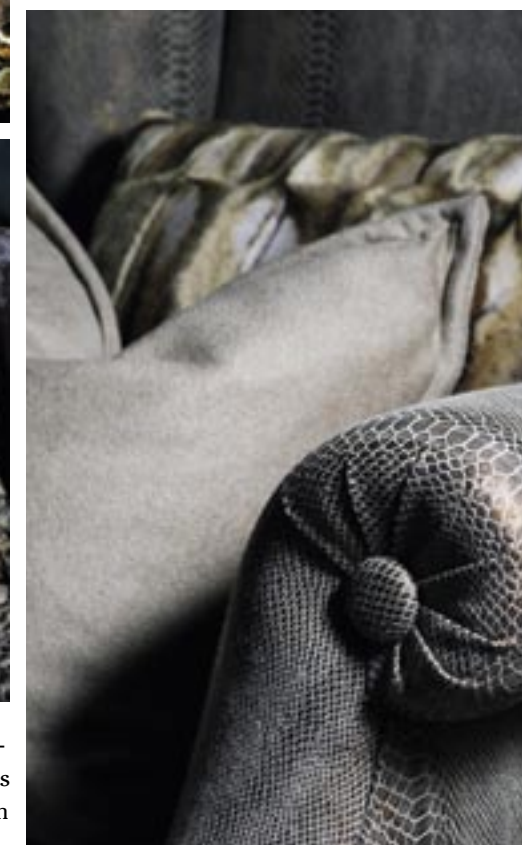
Fauteuil 'Seattle' van Marie's Corner, stof van Lizzo. Kussens van Etro en Loro Piana.